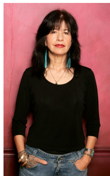
Joy Harjo

Née à Tulsa d'une mère cherokee et d'un père creek, Joy Harjo est la descendante d'une lignée de guerriers et de chefs déportés en Oklahoma dans les années 1830. Très tôt, son esprit curieux la pousse à expérimenter et à créer : musique, arts de la scène, littérature, poésie... Partie prenante du grand élan de résistance et de renouveau de la jeunesse amérindienne des années 1970, elle a toujours cru en sa mission de « faire vivre des voix, des chants et des histoires ». Couronnée par le titre de « poète des États-Unis » en 2019, elle raconte dans ce livre dont le titre traduit son nom creek, Harjo (« So brave you're crazy »), son parcours initiatique.